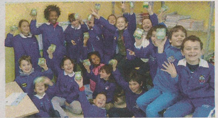
Classe 3ª A "Lombardo - Radice"