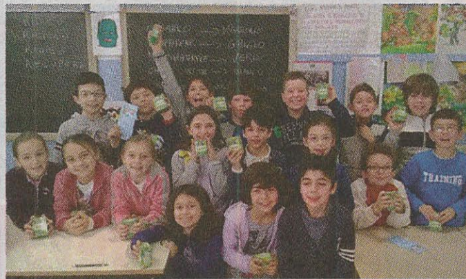
Classe 3ª A "Fornaciari"