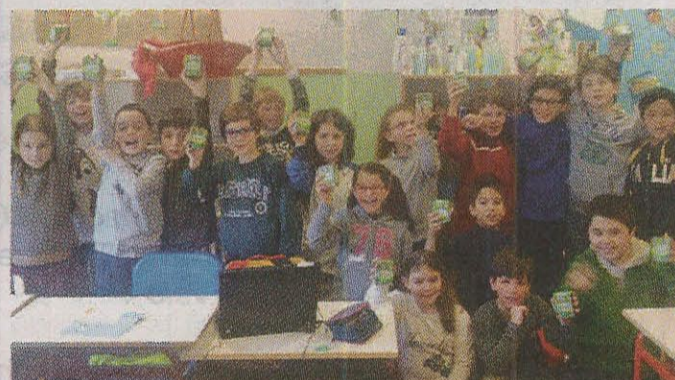
Classe 4ª B "Fornaciari"