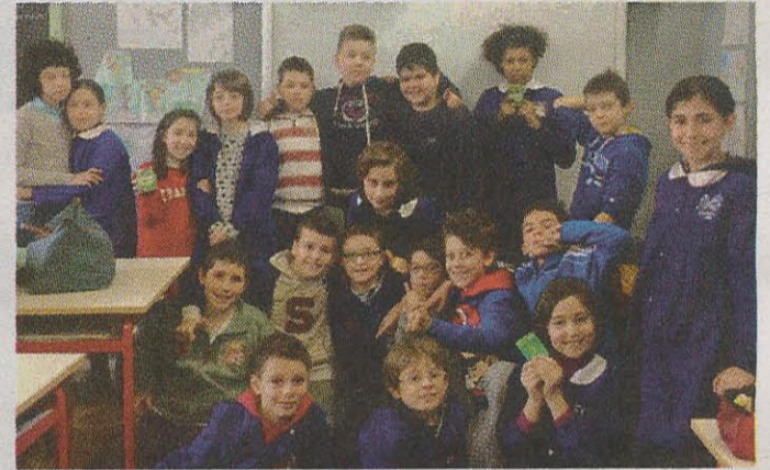
Classe 4ª B "Lombardo - Radice"