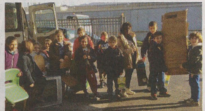
Classe 4ª A "Donatelli"