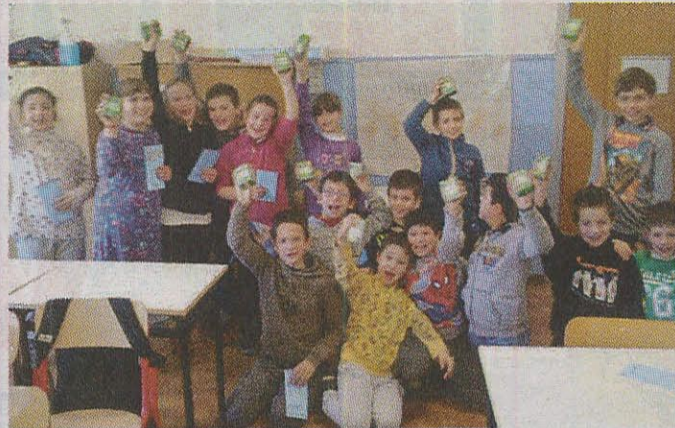
Classe 3ª B "Fornaciari"