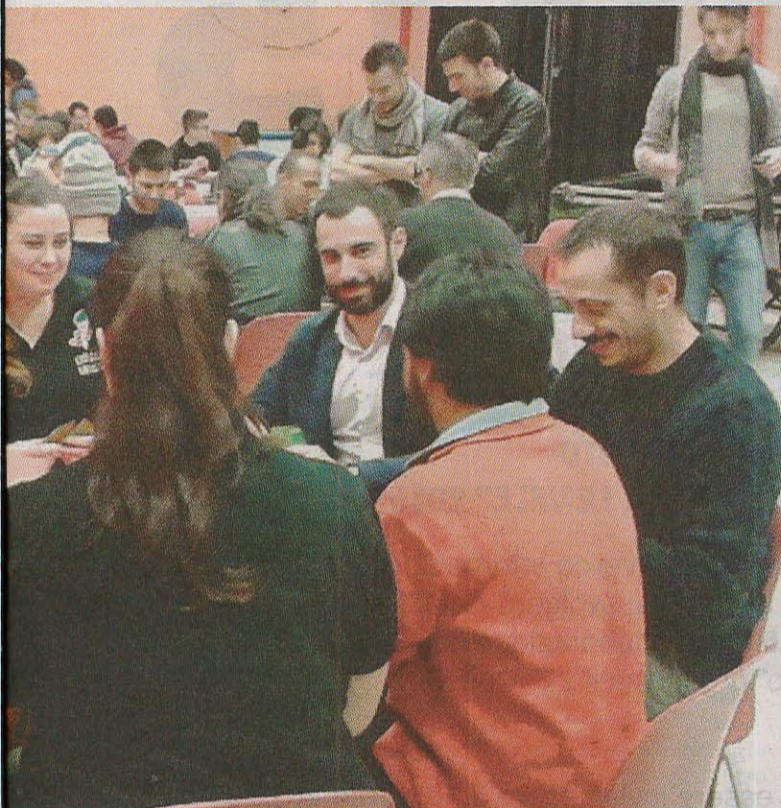
Inelli si divertono giocando con "Scarty"

tre della primaria per esempio raccolgono il tetrapak, i ragazzi della scuola secondaria di primo grado sono invece impegnati in altre attività come lo studio dei cambiamenti climatici e l'assetto idraulico del territorio, inoltre, alcune uscite didattiche sono state organizzate dai docenti utilizzando i mezzi pubblici per educa-