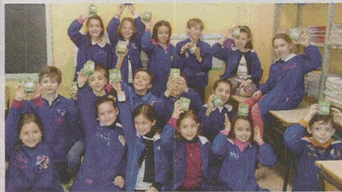
Classe 3ª C "Lombardo - Radice"